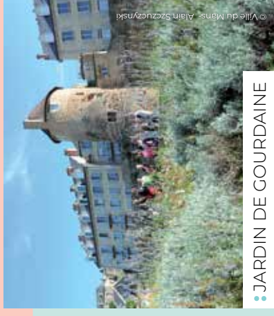
• JARDIN DE GOURDAÏNE

Le patrimoine mobilier est particulièrement varié : vitrail de l'Ascension (circa XI e -XII e siècle) disposé dans la nef au côté d'un bel ensemble de vitraux de styles variés (XII e -XX e siècle) ; grands orgues de style Renaissance ; peintures monumentales des anges musiciens ornant la chapelle de la Vierge ; les terre-cuites datant des XVII e et XVIII e siècles. Le XXI e siècle n'est pas oublié puisque le Christ en gloire réalisé par l'orfèvre Goudji a été installé à l'entrée du chœur.