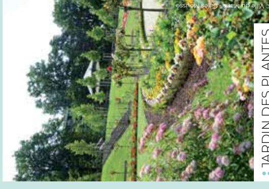
• JARDIN DES PLANTES